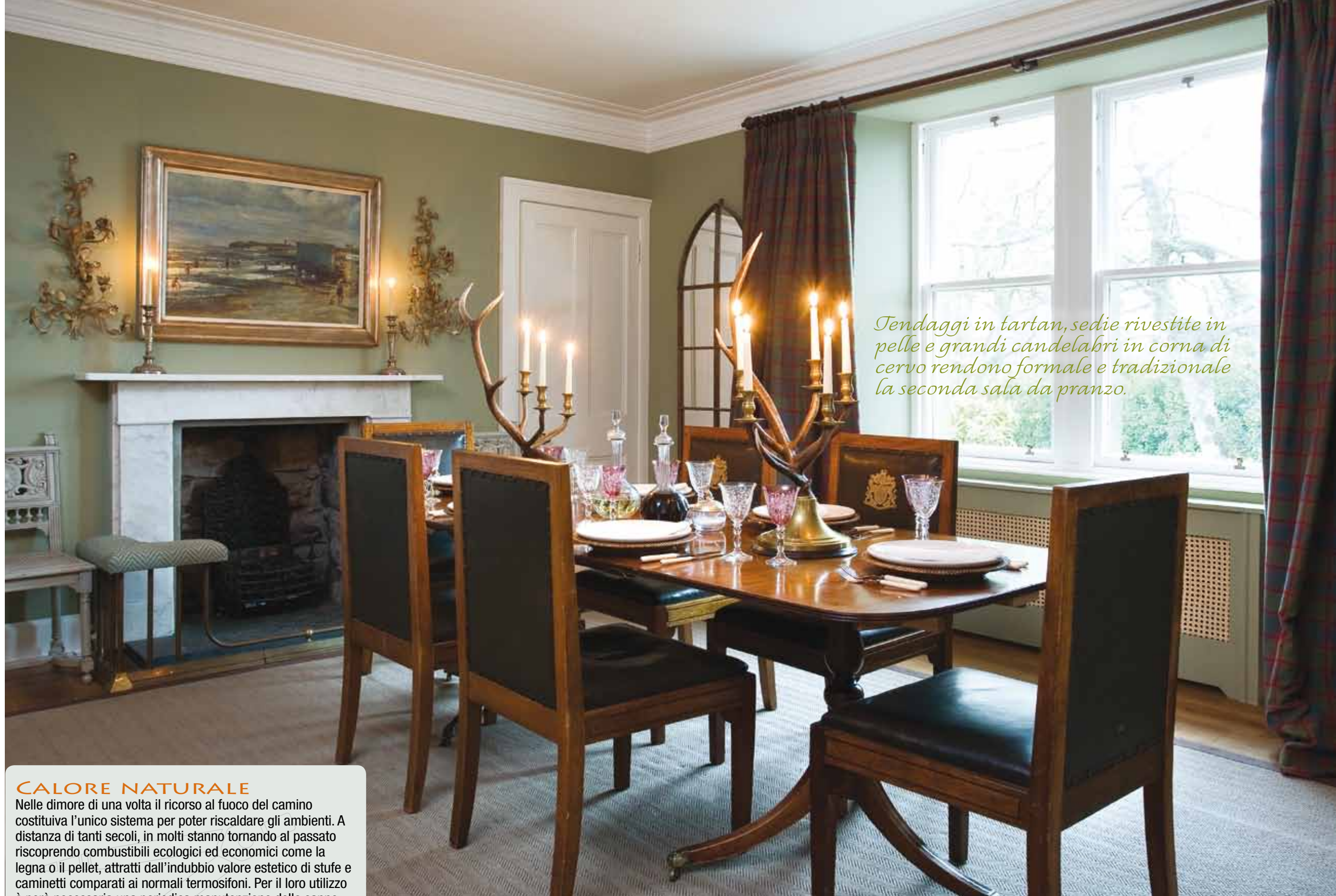
Tendaggi in tartan, sedie rivestite in pelle e grandi candelabri in corna di cervo rendono formale e tradizionale la seconda sala da pranzo.